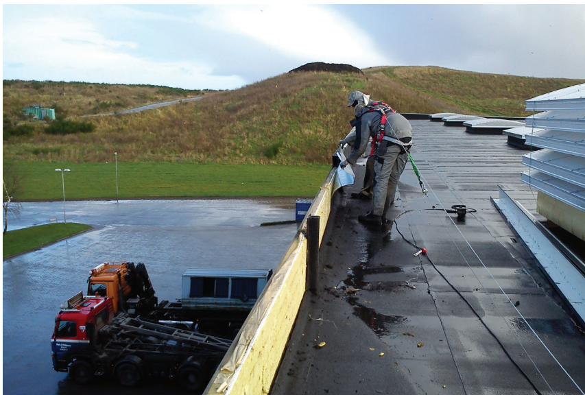
Verden set fra oven!

Vi havde fæstet linerne midt inde på taget, og mens vi arbejdede ude ved kanten, var der flere gange, hvor vi skulle gå en omvej for ikke at vikle os ind i hinandens liner. Jeg oplevede, at man hele tiden var bevidst om, at man skulle passe på, fordi linen rykkede i én. For mig blev rykkene en påmindelse om at være opmærksom. Disse ryk i kroppen gjorde, at linen hele tiden gjorde opmærksom på sig selv. Gjorde den mig tryk? Mest af alt mindede den mig om den risiko for at falde, som jeg var udsat for og dermed om spørgsmålet, om den var sat ordentligt fast. Linen, og den sele den var fastgjort i – og dens fysiske placering på min krop – gjorde, at kroppen var forbundet til selens risiko: Rykkene i linen og oplevelsen af sammenfiltning af linerne blev en oplevelse af en slags indgriben i min måde at begå mig på taget, hvor jeg (der mangler erfaring) forholdt mig mere til selen og linerne og deres risiko, end til taget og højden i sig selv. Rykkene i linen forplanter sig i kroppen som en bevidsthed om fare, om påpasselighed i forhold til tagets kant. Forbindelsen til linenes viden sker