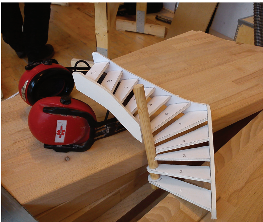
11 trin til en sikker trappe. Modeltrappe fra fjerde hovedforløb.