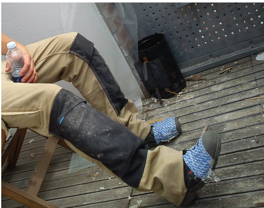
Ad hoc-løsninger: En kaput sikkerhedssko, sat sammen med isoleringstape.

I relation til analyserne af lærlingenes opfattelser af risici i deres arbejde kan begrebet sikkerhedskultur ikke rigtig bidrage med forklaringer, fordi lærlinges sikkerhed på arbejde ikke nødvendigvis er en del af en kultur, men en del af en arbejdspraksis, hvor risiko findes. Sikkerhedskulturbegrebets styrke er ikke at sætte sig ind i andres verden, men at spørge ind til de intellektuelt erkendte holdninger. Her har mit ærinde været at skabe en refleksion over feltarbejdets erfaringer, hvor også fornemmelser og ufuldendte formuleringer, om uvished som held og uheld og fokus på opgaverne som tryghed i jobbet, fortælles og kendes. De to perspektiver på sikkerhed, både uvished og utryghed, er til stede, risiko håndteres og jobbet gøres på en måde, der dels bekræfter, og dels afkræfter normer,